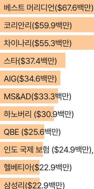
표 5: 세부 석탄화력발전소의 최대 보험사

(뉴질랜드), 파이어니어(Pioneer)(필리핀), 버크셔 해 서웨이(Berkshire Hathaway)(미국), 뉴 인디아(New India)(인도)가 있다.