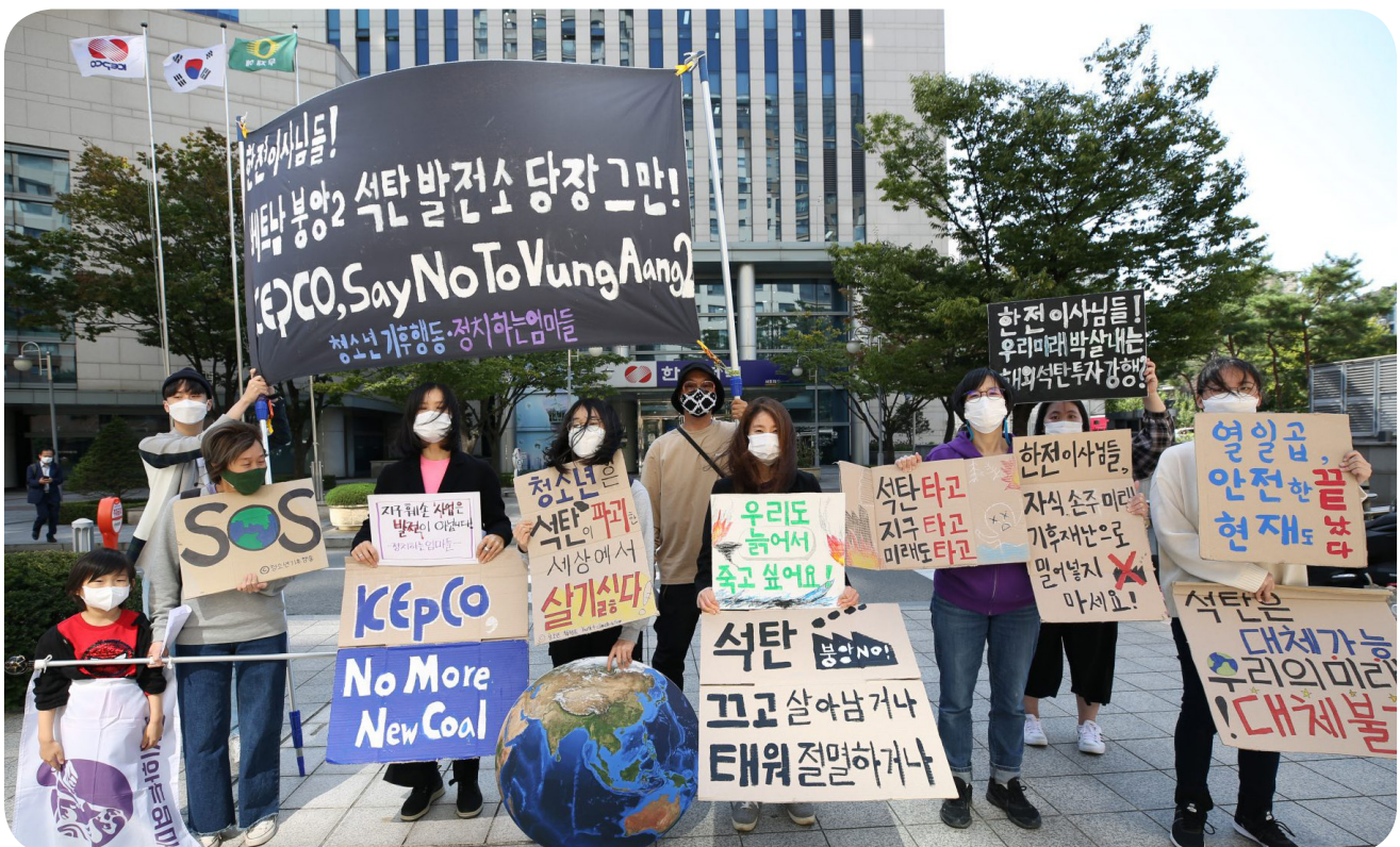
한국 기후운동가들이 한전의 붕양2 석탄화력발전소에 반대하는 시위를 하고 있다.

프로젝트의 다른 보험사로는 히스콕스(Hiscox)(영국), 헬베티아(Helvetia)(스위스), W.R.버클리(W.R. Berkley)(미국), 비즐리(Beazley)(영국), 마켈(Markel)(미국), 트랜스리(Trans Re)(미국), 코리안리(Korean Re)(한국), 캐노피우스(Canopus)(영국), 초서(Chaucer)[차이나리(China Re) 부속, 중국], 안타레스(Antares)(카타르), 신시네티(Cincinnati)(미국), AEGIS(미국), 인도 국제 보험(India International)(인도)이 있다.