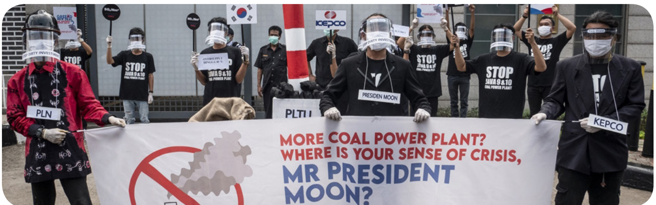
한국 기후운동가들이 한전의 봉양2 석탄화력발전소에 반대하는 시위를 하고 있다.

이 프로젝트의 다른 보험사로는 PICC(중국), AXIS 캐피탈(Axis Capital)(버뮤다), XL 인슈어런스(XL Insurance)(버뮤다, AXA가 인수), 헬베티아(Helvetia)(스위스), 뮌헨리(Munich Re)[뉴리(New Re) 포함, 독일], 트랜스리(Trans Re)(미국), 캐노피우스(Canopus)(영국), 비즐리(Beazley)(영국), 현대해상(Hyundai Fire & Marine)(한국), 코리안리(Korean Re)(한국), 도쿄 해상(Tokio Marine)[도쿄 해상 킬른(Tokio Marine Kiln) 포함, 일본], 아스펜(Aspen)(버뮤다), HDI(독일), 말레이시안리(Malaysian Re)(말레이시아), 파트너리(Partner Re)(버뮤다/이탈리아) 안타레스(Antares)(카타르), 인도 국제보험(India International)(인도)이 있다. 일부 대규모 글로벌 보험사의 부재로 인해 다수의 소규모 보험업자가 이 프로젝트에 참여해야 했던 것으로 보인다.