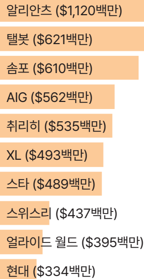
표 2: 응이손 2 석탄화력발전소 최대 보험사

이 프로젝트의 다른 보험사로는 페트로베트남 보험(PetroVietnam Insurance)(PVI, 베트남), 코리아리(Korea Re)(한국), 삼성리(Samsung Re)(한국), 비즐리(Beazley)(영국), 캐노피우스(Canopus)(영국), 도쿄해상(Tokio Marine)(일본), 리버티 뮤추얼(Liberty Mutual)[아이언쇼어(Ironshore) 포함, 미국], 미츠이 스미모토(Mitsui Sumitomo)(일본, MS&AD 부속), QBE(호주)가 있다.